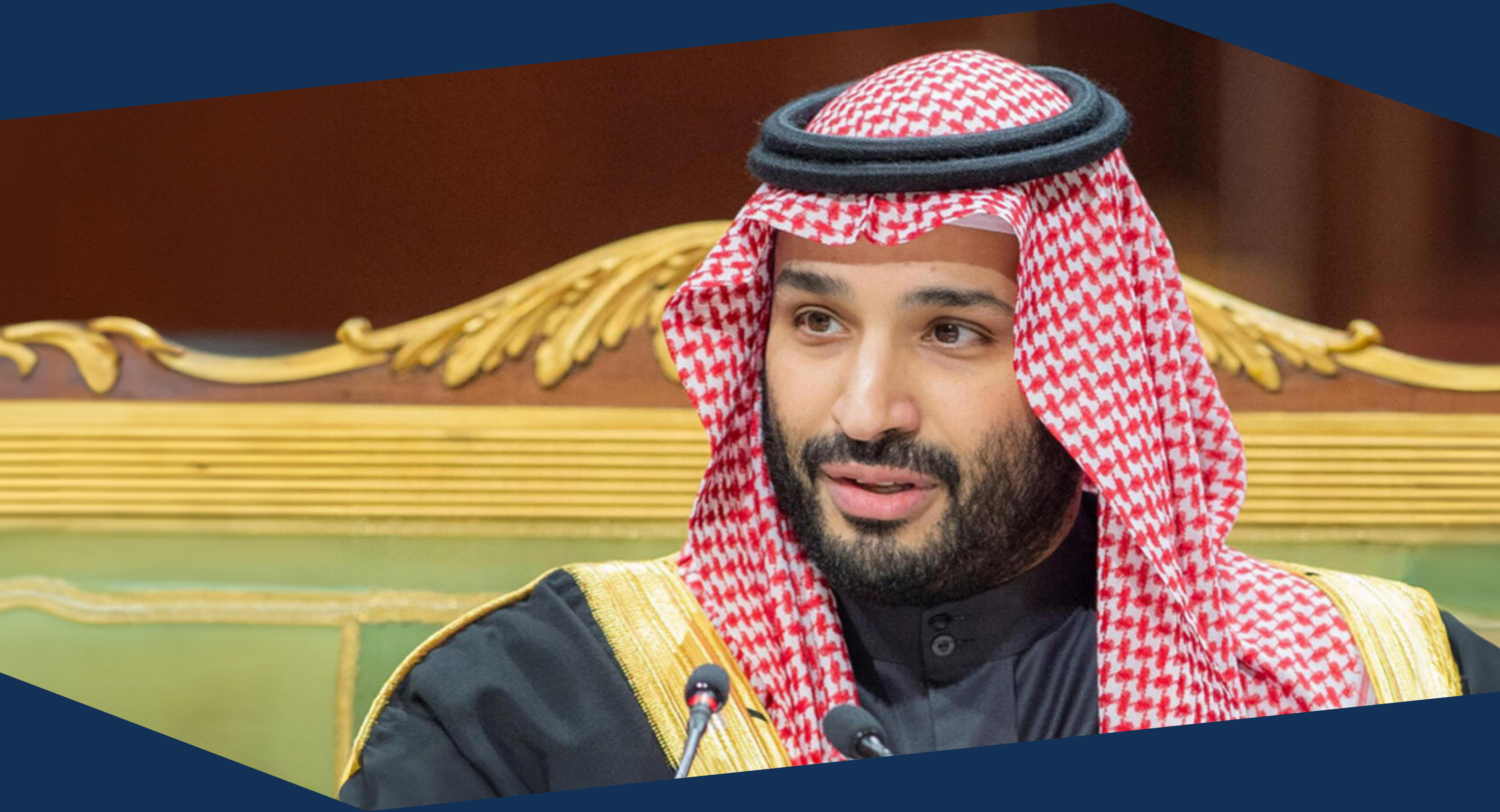
ولي العهد صاحب السمو الملكي الأمير محمد بن سلمان بن آل سعود