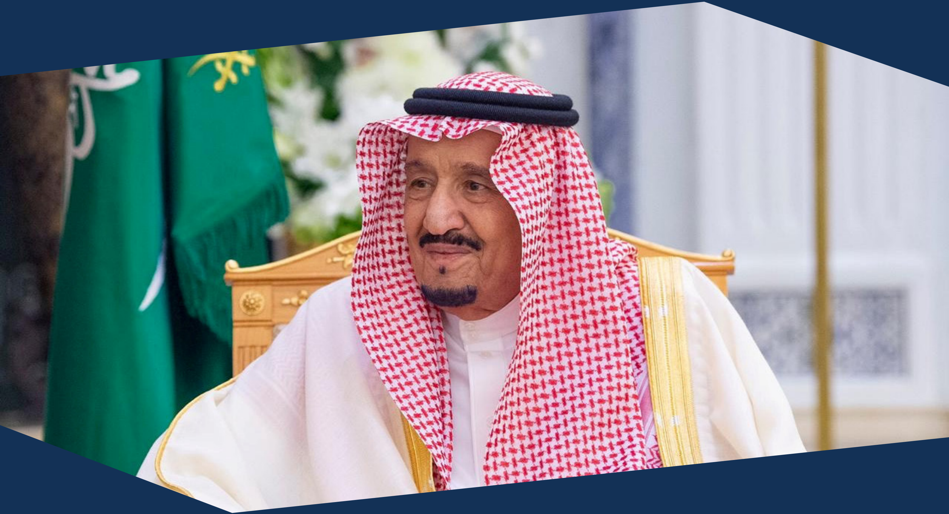
خادم الحرمين الشريفين الملك سلمان بن عبد العزيز آل سعود